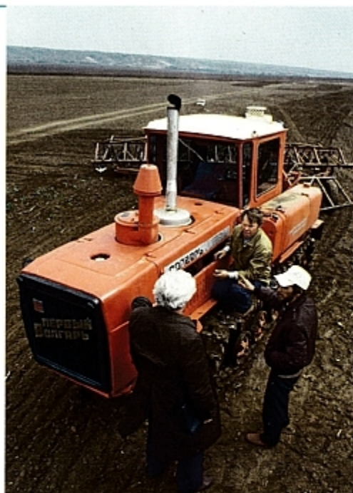
Испытатели первого опытного образца трактора ДТ-175 в поле колхоза имени 50-летия СССР в Дубовском районе Волгоградской области.

сцеплением, топливным насосом, сцеплением пускового двигателя, а также длины топливно-и маслопроводов также изменены.