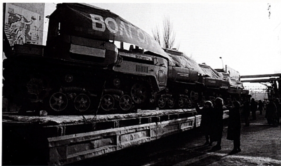
Партия тракторов ДТ-175 перед отправкой механизаторам.

Тягово-сцепное устройство прикреплено к задним соединительным кронштейнам рамы с помощью бугелей, болтов и пальцев. Сельскохозяйственные орудия соединяют с вилкой с помощью шкворня, который для фиксации в отверстии вилки снабжен автоматической защелкой. Для удобства использования шкворня к его головке приварен стержень, выполняющий роль рукоятки. На прицепной скобе на равных расстояниях расположены пять отверстий. Это позволяет установить сельскохозяйственные орудия в смещенном состоянии относительно продольной оси трактора в правую или левую сторону.