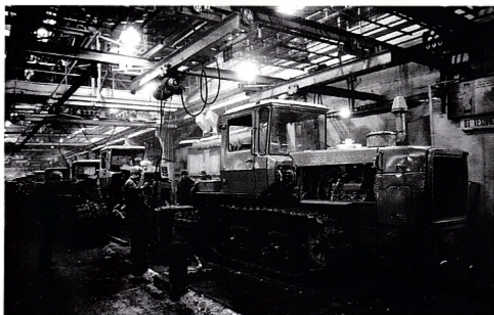
Энергонасыщенные тракторы ДТ-175 на сборочном конвейере.