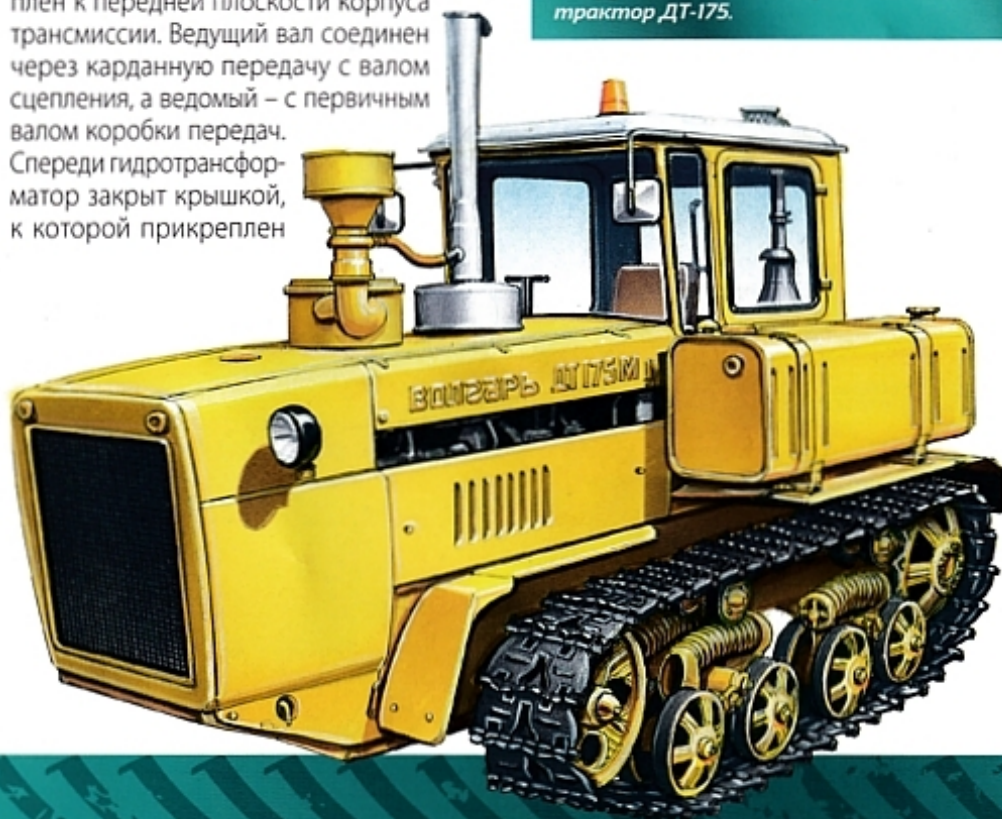
Сельскохозяйственный гусеничный трактор ДТ-175М.

Гидромеханическая трансмиссия резко снижает динамические нагрузки на детали, способствуя увеличению их долговечности; улучшает плавность хода; снижает буксование гусениц и повреждение почвы, что уменьшает ее эрозию и улучшает проходимость машины по слабонесущим грунтам и снегу.