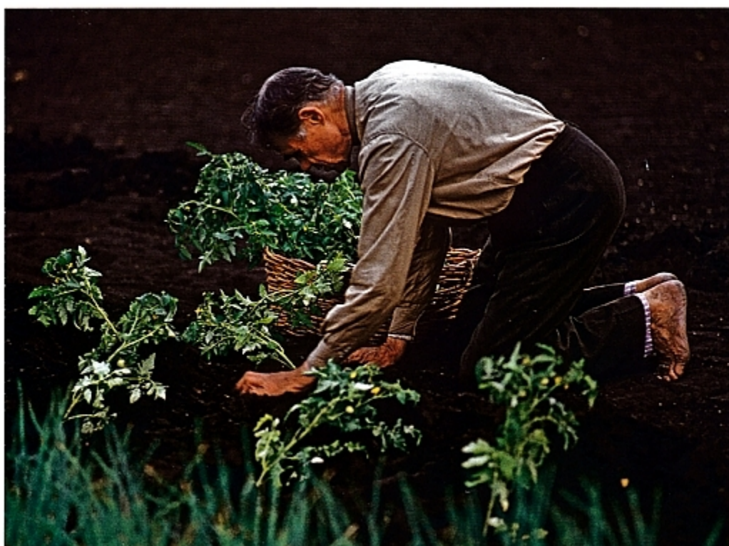
На своем приусадебном участке Мальцев тоже всю жизнь экспериментировал.

Уже став почетным академиком Всесоюзной академии сельскохозяйственных наук имени Ленина, дважды Героем Социалистического Труда, Мальцев предупреждал: «...безотвальная обработка почвы может оказаться полезной лишь в том случае, когда она