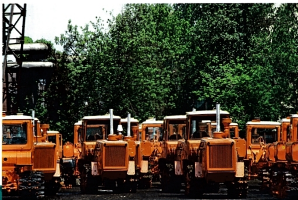
Первая партия тракторов ДТ-175, только что сошедшая с конвейера. 1986 г.

При повышении температуры рабочей жидкости выше допустимой (98 ... 104 °С) на щитке приборов загорается красная сигнальная лампа. Для блокирования (выключения) гидротрансформатора служит зубчатая муфта, связанная через специальное устройство с рычагом в кабине. При перемещении рычага на себя зубчатая муфта соединяет ведущий и ведомый валы гидротрансформатора, выключая гидротрансформатор из работы.