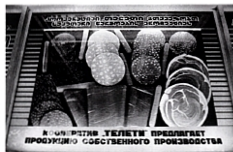
Витрина кооперативного магазина в Тбилиси. 1987 г.

К 1986 году обстановка в стране сложилась тяжелая. Сельское хозяйство не обеспечивало население продуктами. Партийное руководство, опасаясь голодных бунтов по образцу Новочеркасска 1962 года, вынуждено было закупать десятки миллионов тонн продовольствия за рубежом. До поры до времени это позволял поток нефтедолларов. Однако в середине 1980-х цены на нефть резко снизились: с 27 долларов в 1985 году до менее чем 10 в 1986-м. Дополнительный удар по доходам бюджета нанесла непродуманная антиалкогольная кампания. Дефицит самого