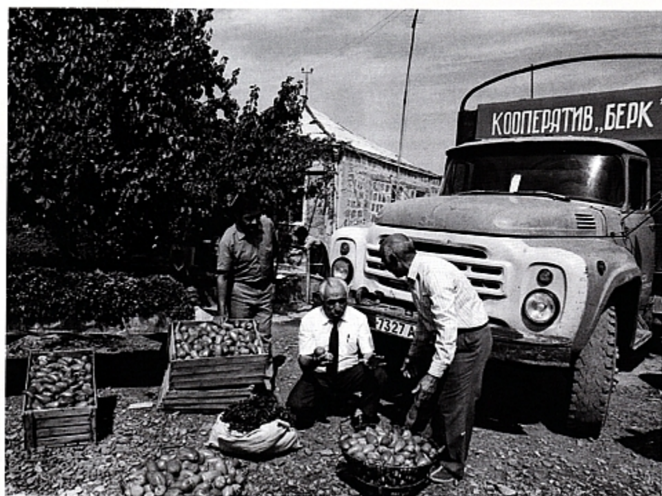
Кооперативы могли закупать продукцию с личного подворья.

Однако по-настоящему заняться хозяйством на земле крестьяне получили возможность лишь после земельной реформы, начавшейся в 1990-х годах. Уже в 1995 году существовало 280 тыс. фермерских хозяйств. Затем их количество стало снижаться. Уменьшение числа фермерских хозяйств связано с укреплением реальных и разорением неэффективных производителей. Но темпы роста в период с 1999 по 2009 год были выше в 4,3 раза, чем по отрасли в целом. К 2018 году в России осталось 135 тыс. фермеров. Несмотря на это, их роль в производстве сельскохозяйственной продукции страны растет (с 2,5 % в 2000 до 10 % в 2018 году).