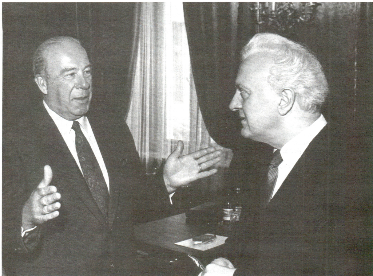
Встреча один на один