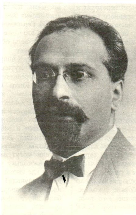
Лев Михайлович КАРАХАН (1889–1937)

Лев Михайлович Карахан (Карахян) — активный участник революционного движения, советский государственный деятель, дипломат ленинской школы. Его имя неразрывно связано с созданием аппарата Народного комиссариата иностранных дел, историей советской дипломатии.