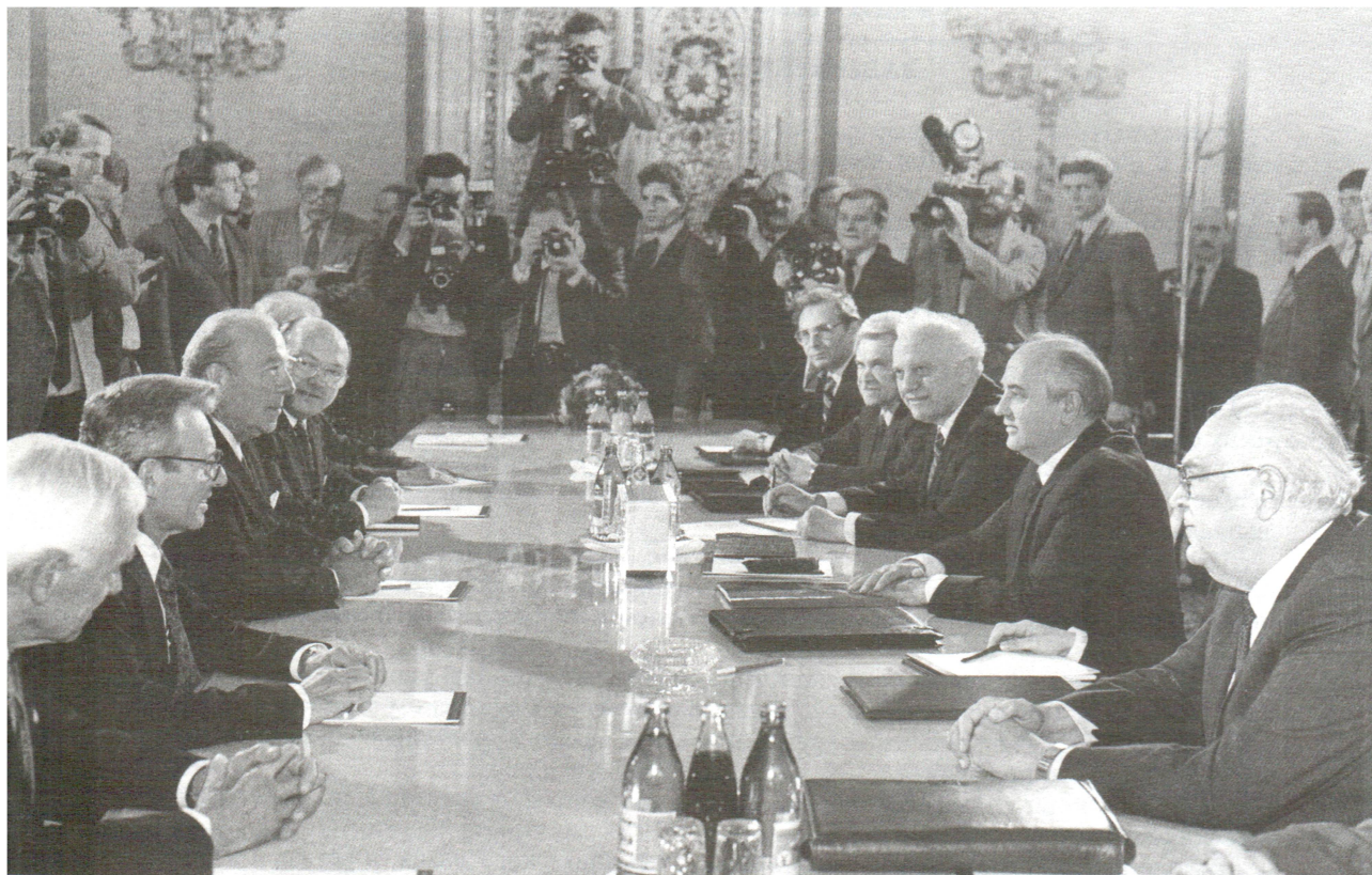
Встреча в Кремле