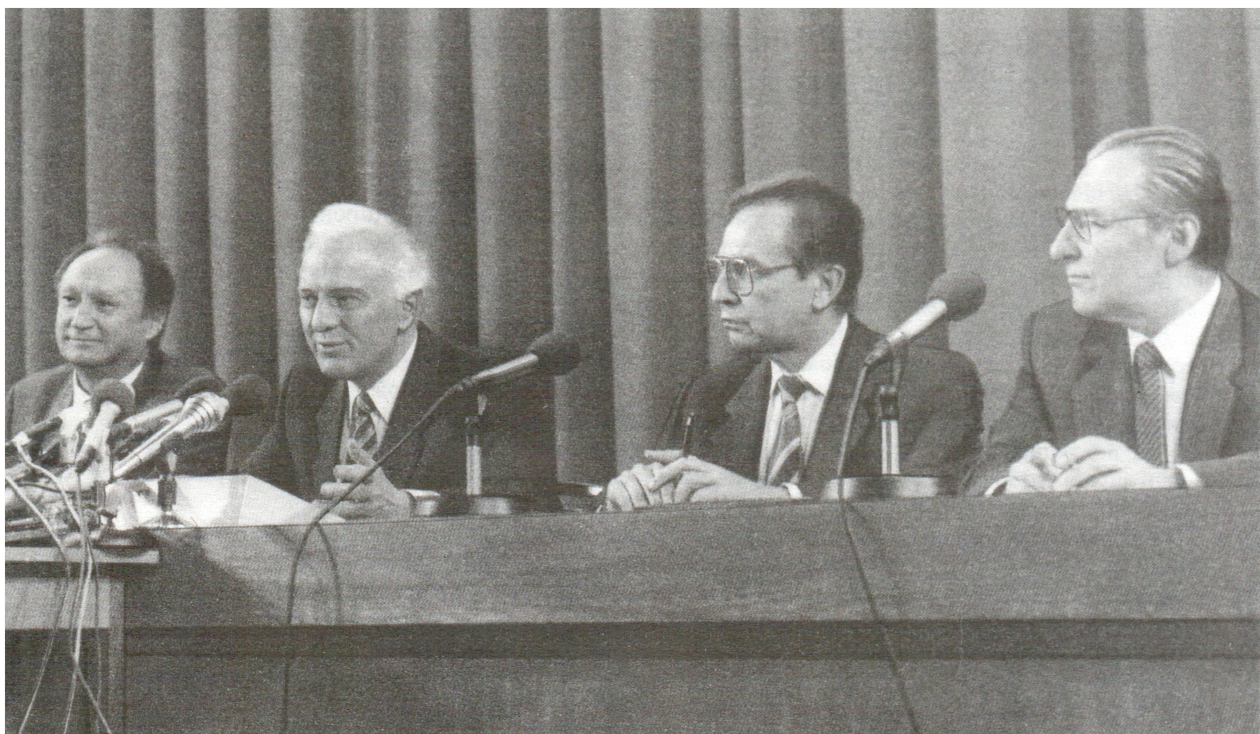
Во время пресс-конференции