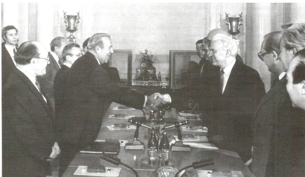
За столом переговоров