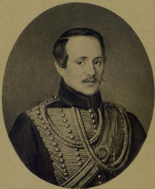
МИХАИЛ ЮРЬЕВИЧ ЛЕРМОНТОВ