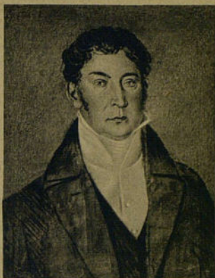
Юрий Петрович Лермонтов, отец поэта.

Лермонтову было одиннадцать лет, когда в Тарханы стали доходить слухи о том, что 14 декабря 1825 года в Петербурге, на Сенатской площади, произошло восстание. Рассказывали, что восставшие (их стали позднее называть декабристами) хотели свергнуть царя и отменить крепостное право. Потом дошел слух о казни руководителей вос-