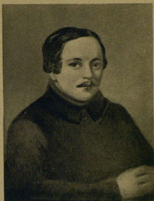
М. Ю. Лермонтов, 1830—1831 годы.

Весть о гибели великого поэта поразила Лермонтова; он не мог примириться с мыслью о том, что Пушкина нет. В порыве истинного горя и отчаяния Лермонтов написал свое замечательное стихотворение «Смерть поэта». В этом стихотворении он с волнением и гневом говорил о своей ненависти к виновникам гибели Пушкина. Люди знатные и богатые, вместе с царем Николаем I правившие Россией, ненавидели и преследовали великого поэта, боялись его обличительных стихов, хотели его смерти. Лермонтов за-