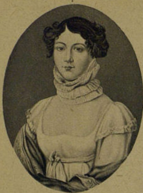
Мария Михайловна Лермонтова, мать поэта.

внуку не было скучно, бабушка взяла в дом нескольких мальчиков. Дети вместе учились, играли в войну, ездили верхом, гуляли, часто ссорились — маленький Лермонтов всегда и во всем хотел быть первым. Он был мальчиком своевольным, вспыльчивым, буйным, но сердце у него было доброе, отзывчивое. Бабушка его была помещица, и крепостным крестьянам жилось у нее плохо. Рассказывали, что, совсем маленький, Лермонтов «напу-