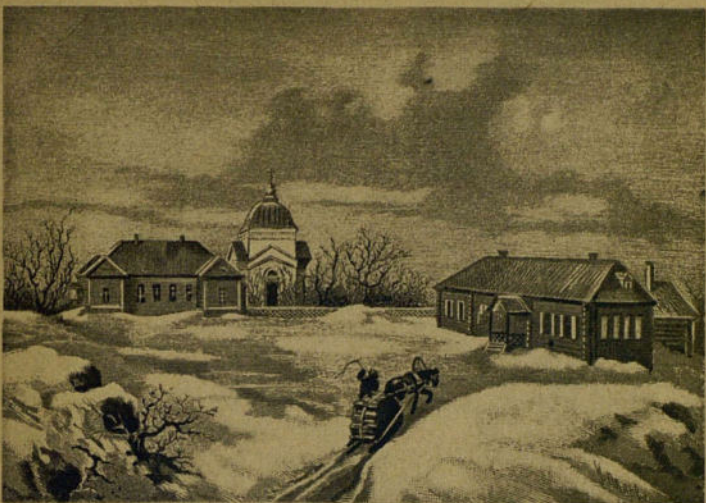
Дом в Тарханах.

В пансион проникали произведения, которые царское правительство запрещало печатать. Это были революционные стихи Пушкина, декабриста Рылеева и других поэтов. Их переписывали и тайно распространяли по всей стране. Молодежь с увлечением читала эти мятежные стихи, заучивала их наизусть.