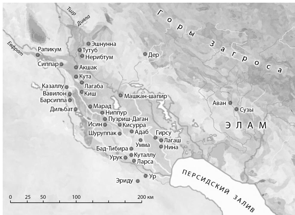
Карта 2. Южная Месопотамия в начале II тыс. до н. э. Основные топонимы, упоминаемые в тексте

Объединение такой большой территории в единую политическую и хозяйственную структуру происходило, очевидно, постепенно и достаточно мирно. В какой-то степени оно стало продолжением на новом историческом этапе тех процессов культурно-хозяйственной унификации, которые были характерны для Южной Месопотамии еще в V тыс. до н. э., а в конце IV тыс. до н. э. привели к возникновению здесь союза городов.