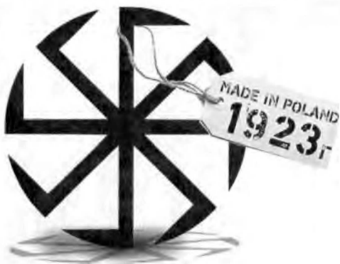
Фальшивый коловрат польского художника С. Якубовского