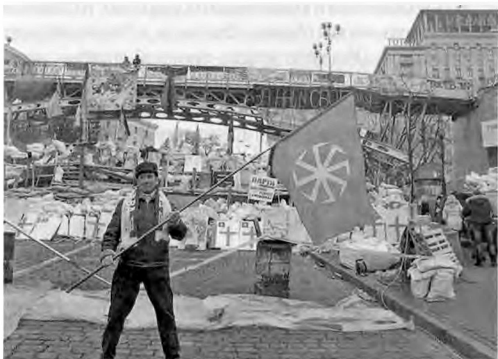
Владимир Истархов на Майдане

популярность уфологических религий 1950-х и духовного утопизма 1960–1970-х. К концу 1970-х движение достигло наибольшего расцвета на Западе в процессе развития независимых теософских групп Великобритании и других стран. В России и странах СНГ New Age также достаточно популярно, особенно в среде почитателей Е. Блаватской и Рерихов.