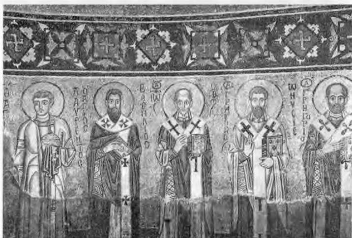
Гамматические мозаичные кресты под куполом собора Святой Софии Киевской

«громовик», «светокруг», «коловрат» и т. п. были просто плодами фантазии авторов данных статей, ссылки на какие-либо научные исторические исследования не приводились. В этих статьях свастика называлась исконным славянским символом, хотя это утверждение ошибочно: разновидности свастик известны во многих культурах. Они используются и в христианской Церкви; в частности, книга «Как выбрать нательный крест» (М.: Трифонов Печенежский монастырь; Ковчег, 2002) приводит следующую информацию: «Крест гамматический (свастика). «Гамматическим» этот крест называется потому, что состоит из греческой буквы «гаммы». Уже первые христиане в римских катакомбах изображали гамматический крест. В Византии эта форма часто употреблялась для украшения Евангелий, церковной утвари, храмов, вышивалась на облачениях византийских святителей. В IX веке по заказу императрицы Феодоры было изготовлено Евангелие, украшенное золотым орнаментом из гамматических крестов.