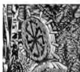
гравюра с. якубовский

(В 90-е годы XX века неоязыческие газеты в большом количестве тиражировали статьи с рисунками разного вида свастик с названиями и описаниями каждой. Названия вроде