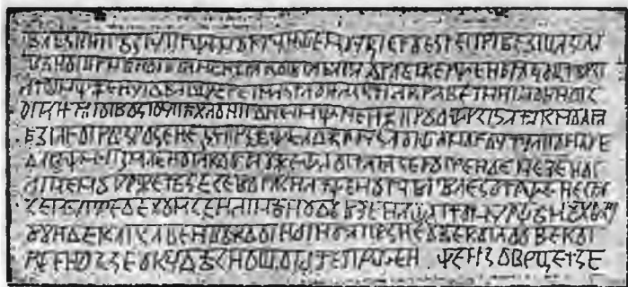
Единственная «дощечка» «Велесовой книги»